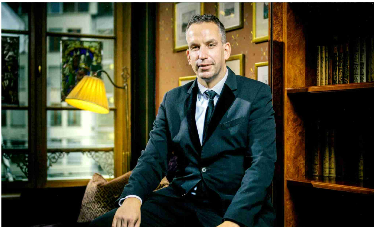
Bar Les Trois Rois, Basel