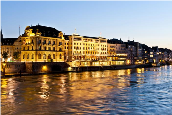
Grand Hotel Les Trois Rois